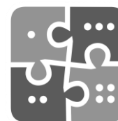
Методология работы с НСИ