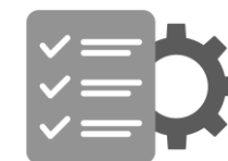
Регламенты и инструкции