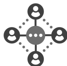
Группы ведения НСИ